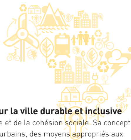
TABLE RONDE 4