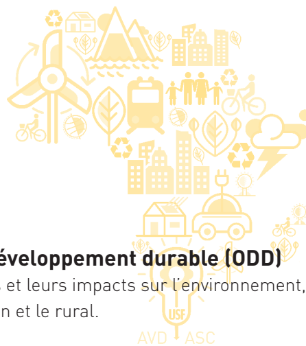
TABLE RONDE 1