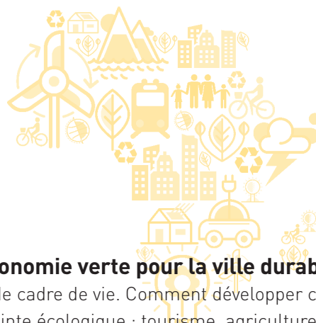
TABLE RONDE 3