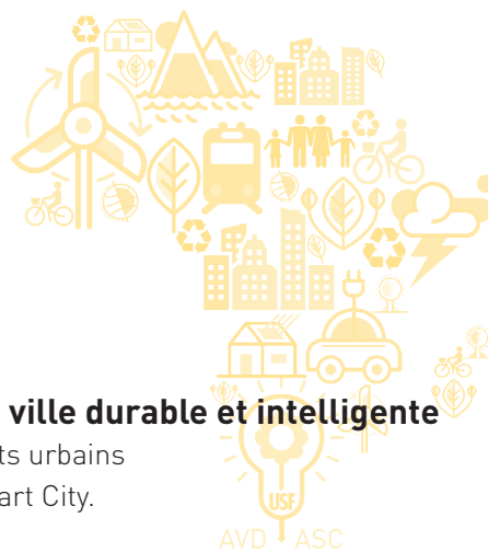
TABLE RONDE 2